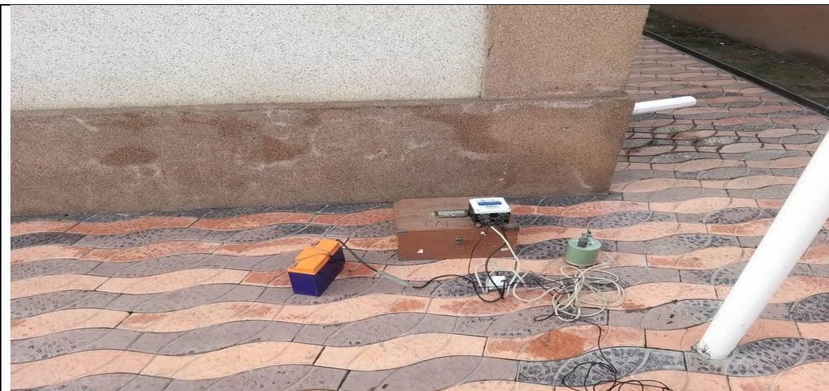
Приложение 4. Фотографии проведения вибрационных исследований на объекте и непосредственно в местах поступления жалоб на образование трещин.